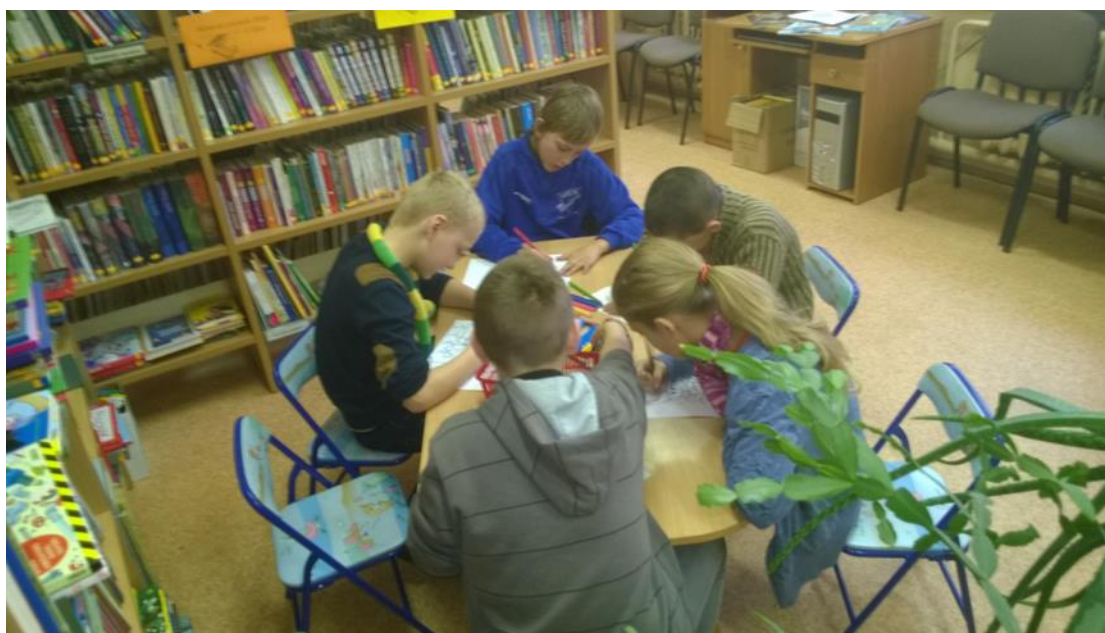
Bērni darbojas Garozas bibliotēkā